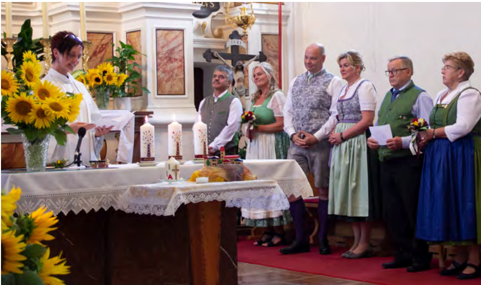
Jubelpaare 2022, Foto: Kurt Prügger

„Welch Glück und Gnade für all jene, die ein besonderes Ehejubiläum erleben dürfen....“