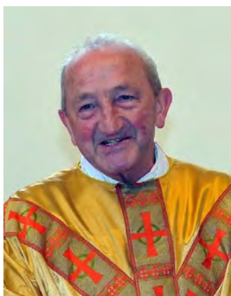
Goldenes Priesterjubiläum 30. Juni 2013

Große Ehre wurde unserem Jubilar beim Goldenen Priesterjubiläum zuteil. Zahlreiche Ehrengäste aus nah u. fern waren gekommen und „ganz Moosdorf“ war auf den Beinen... Feier am 30. Juni in Moosdorf