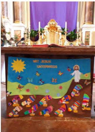
Plakat zur Vorstellung der Erstkommunionkinder in der Pfarrkirche. Gottesdienst am Sonntag, 5. März 2023